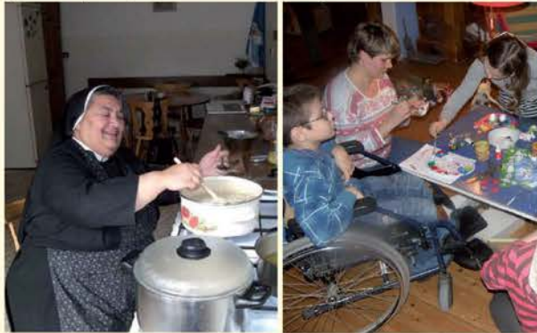
starostlivosť o núdznych v občianskom združení MAGIS

ĎAKUJEME všetkým ľuďom dobrej vôle, ktorí sa zapojili a zapájajú do zbierky Podelme sa . Prijmite naše úprimné poďakovanie za vašu veľkorysosť a šlachetnosť. Máte zásluhu na pozitívnej zmene životov mnohých ľudí dnes i v budúcnosti.