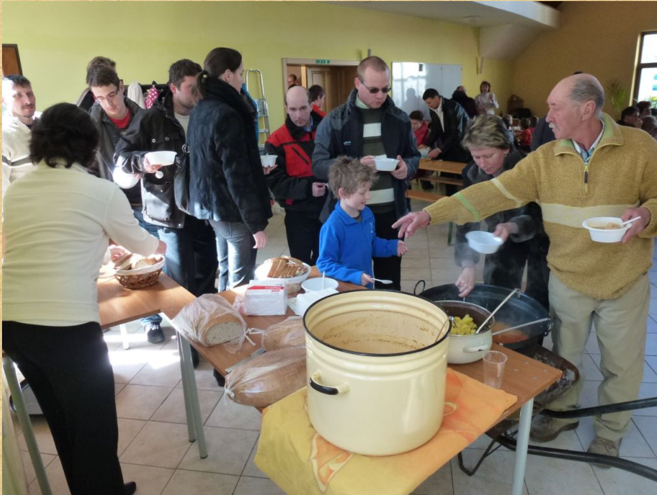
Pôstna polievka Žilina 24. 3. 2013