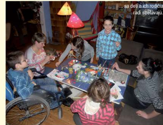
... sa deťi a ich rodičia radi stretávajú.