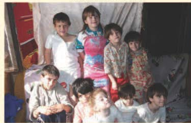
Mnohohodná rodina z Rožňavy.