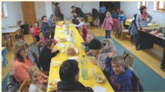
V Cíferi sa zišli všetky generácie.