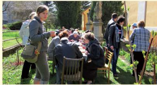
Podujatie Podelme sa! vo farskej záhrade v Starej Turej.