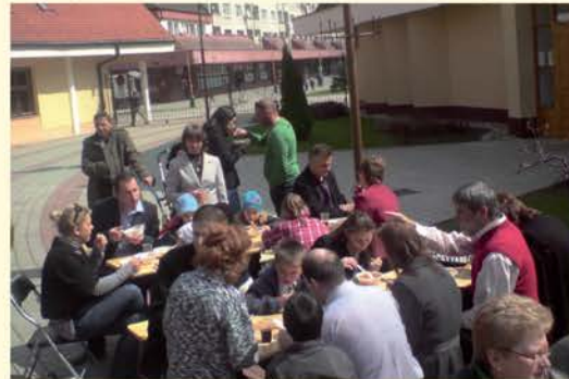
V pastoračnom centre v Žiline všetkým veľmi chutilo.