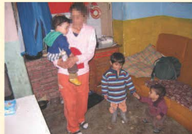
Osamelá matka z Lučenca.

Na vytvorenie nízkoprahového denného centra pre matky s deťmi v hmotnej núdzi v meste Lučenec – stavebné úpravy priestorov, nákup zariadenia, nábytku a pomôcok na vytvorenie pracovných aktivít pre matky a vzdelávacích aktivít pre deti.