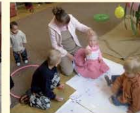
V priestoroch kláštora Sancta Maria sestier Congregatio Jesu ...