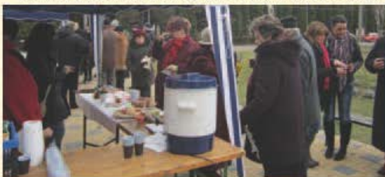
Podujatie Podme sa! bolo aj v Báhoni.