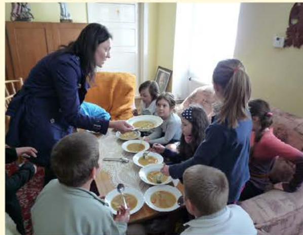
Pôstna polievka pre najmenších na fare v Lozorne.