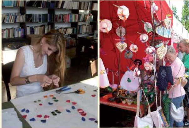
výroba a predaj výrobkov z chránenej dielne

Výťažok 6. ročníka (2012) bol v súlade s jej účelom použitý v Občianskom združení MAGIS, ktorý spolupracuje so sestrami s Congregatio Iesu a sídli v Prešove. Vybuďovalo sa nízkonákladové bývanie pre rodiny v núdzi a mladých ľudí – deti, ktoré ukončili pobyt v detských domovoch; vytvorila sa chránená remeselná dielňa; prebiehajú osvetové aktivity zamerané na prevenciu násillia v rodine.