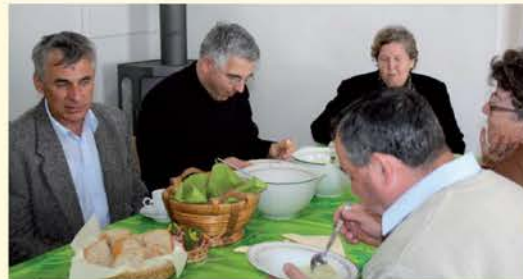
Stretnutie pri „pôstnej polievke“ na fare v Lozorne.