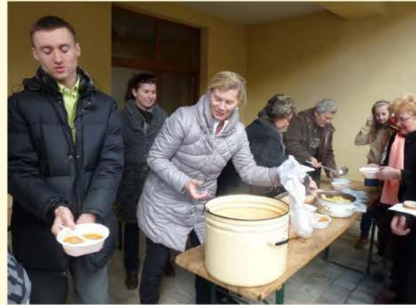
Žilinskí farníci pri pôstnom obede v pastoračnom centre.